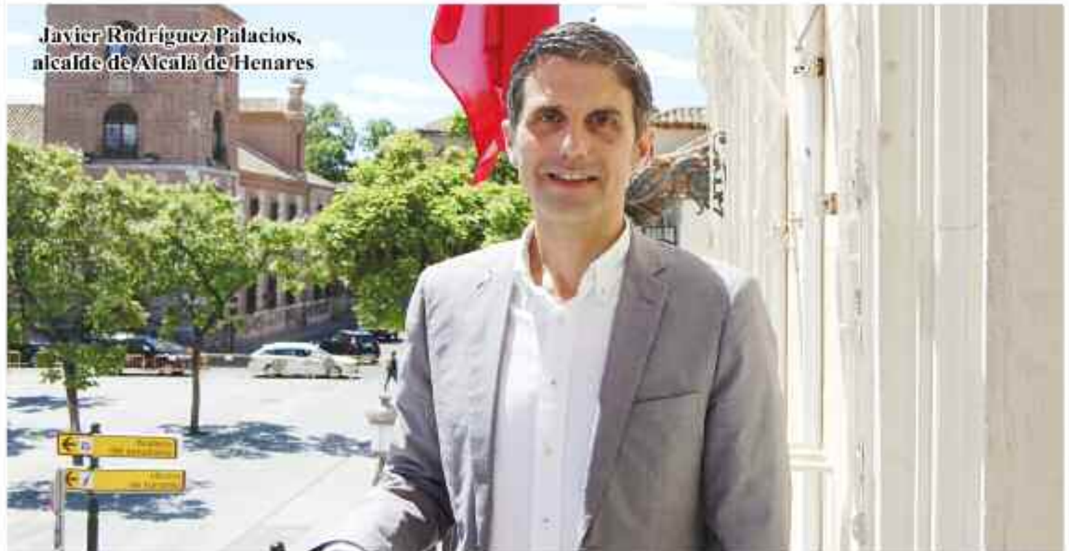
Javier Rodríguez Palacios, alcalde de Alcalá de Henares

Los mayores alcaláinos podrán disfrutar de una semana de vacaciones desde 74 euros, según el nivel de ingresos