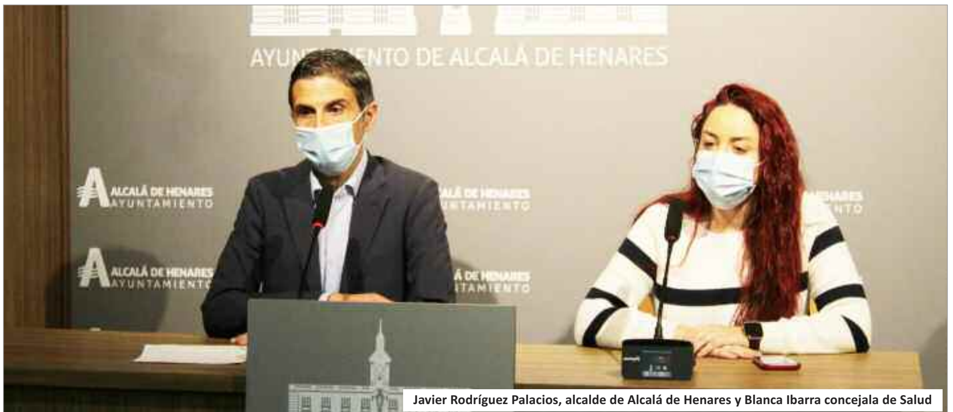
Javier Rodríguez Palacios, alcalde de Alcalá de Henares y Blanca Ibarra concejala de Salud

El alcalde de Alcalá de Henares, Javier Rodríguez Palacios, y la concejala de Salud, Blanca Ibarra, comparecieron en rueda de prensa con el objetivo de valorar cómo se está llevando a cabo el proceso de vacunación en la ciudad complutense.